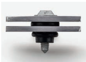
Nach der Montage: b&m-VIBE® bildet Wulst zur Aufnahme und Ableitung von Schwingungen und Geräuschen