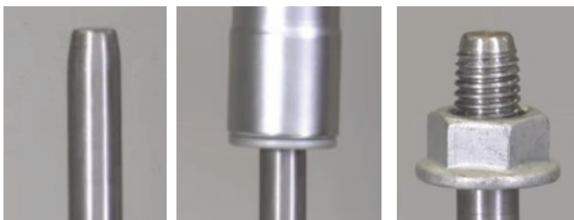
Dado autoformante: Bullone prima e dopo l'applicazione di b&m-TRIMNUT®