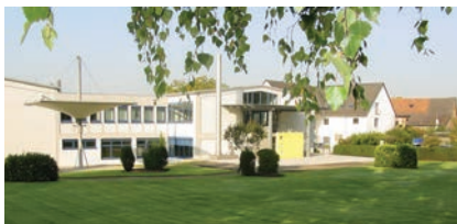
La sede centrale del Gruppo si trova in una posizione idilliaca a Ober-Ramstadt vicino a Francoforte.